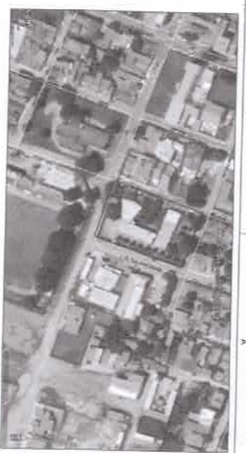
02 IMAGEM DE SATELITE